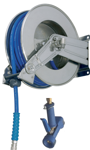
inkl. Orig. Dinga Reinigungspistole

Fertig konfektioniert, für Wandmontage, rostfreie Ausführung in Edelstahl, mit Rückzugfeder.